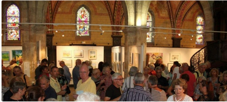
Condom - Come back de l'Exposition Anglaise

La 18ème édition de l'Exposition Anglaise a ouvert ses portes à l'Espace Saint-Michel de Condom.