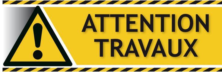
RN 124 - Déviation de Gimont