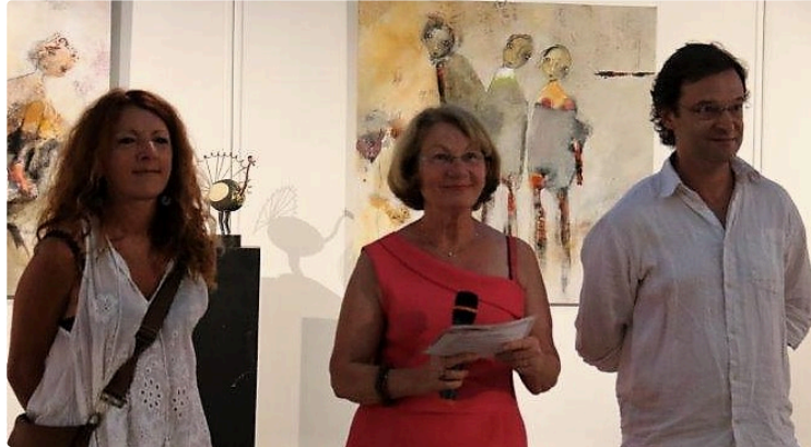
Condom - "Que le rêve l'emporte"

L'Exposition anglaise a fermé ses portes le 31 juillet à l'Espace Saint-Michel, pour laisser place à trois artistes venus présenter « Que le rêve l'emporte ».