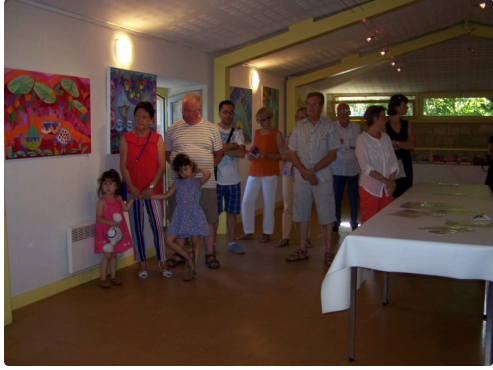
Des invités sous le charme de oeuvres