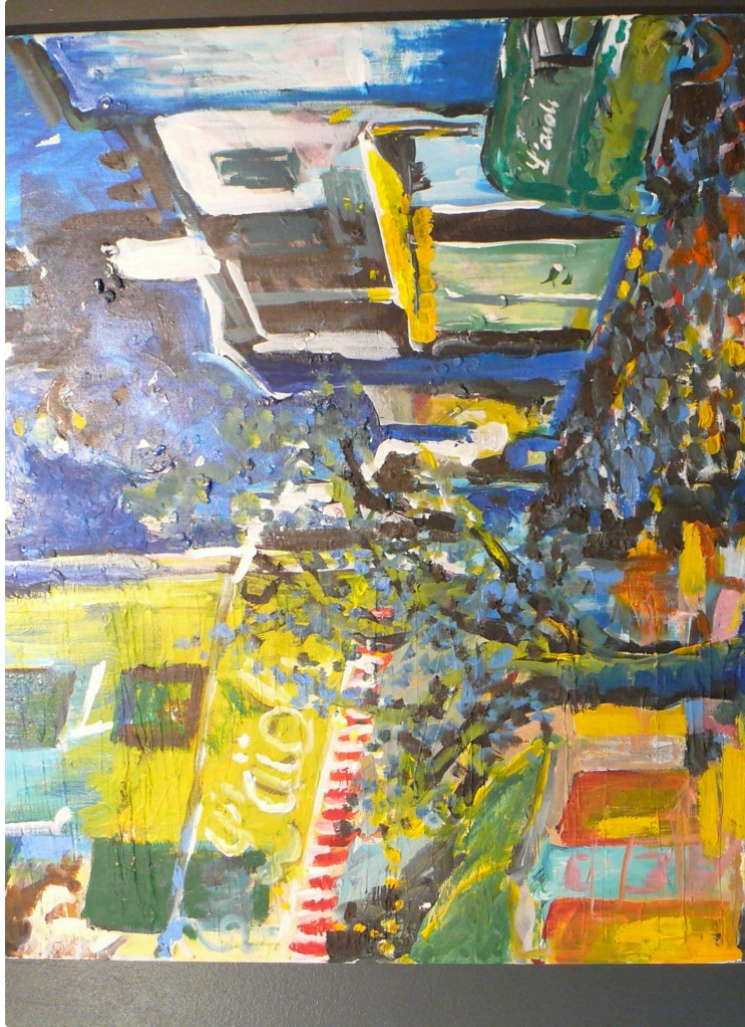
Auch : La galerie Nou'Arts s'internationalise