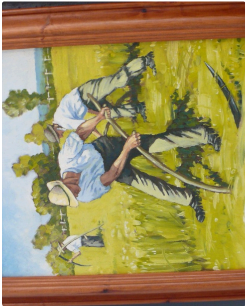
Francis Uwins, les moissonneurs.