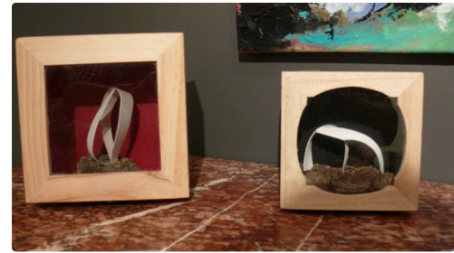
Sculptures de Arturo Gomez Sanchez.