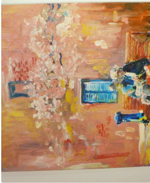
Pim Harren, deux petits vieux émouvants assis sur un puits sous la glycine où on entend leurs chuchotements.