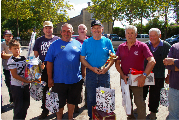
Concours de pêche "Roger Renaud " de la fête

Vingt et un pêcheurs dont un enfant au rendez vous