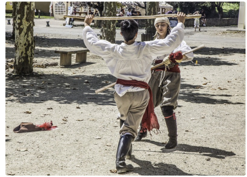
Duel au bâton