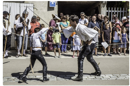
Suite de ce duel