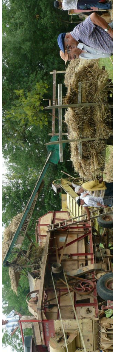
Auterrive : Le battage à l'ancienne a retrouvé des couleurs

Même si la matinée a été tronquée par la pluie, cette journée de battage à l'ancienne du 15 août a retrouvé tout son lustre dans l'après-midi à commencer par le repas des « battusaires » qui a connu un gros succès puisqu'affichant complet. Puis sur le coup de 15 heures les animations reprirent avec le fameux dépiquage, et les nombreuses expositions de matériels agricoles anciens.