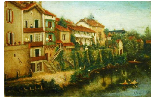
La même en 1936 la tour en bois victime d'un incendie a disparu