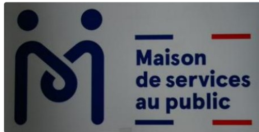
Les Maisons de services au public du Gers vous ouvrent leurs portes

Du lundi 18 au samedi 23 septembre 2017 se tiendront les « Journées Portes Ouvertes » des Maisons de Services au Public (MSAP).