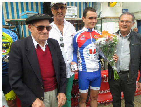
Arrivée en 2016