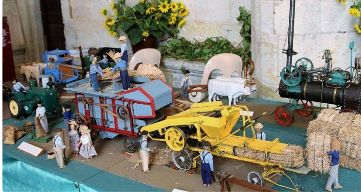
Condom - L'expo à remonter le temps