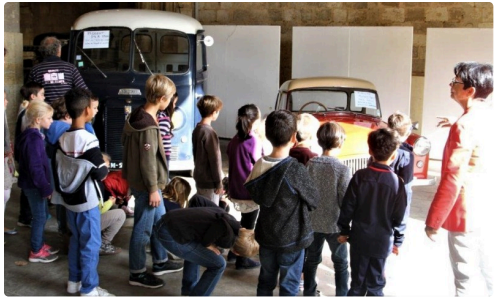
De drôles de choses qui ont impressionné les scolaires