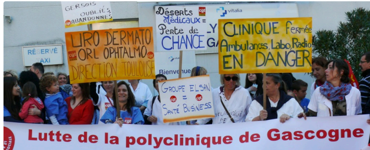
Manifestation à la polyclinique : "Tout se passe au-dessus de nos têtes", regrette le syndicat CGT qui revendique une table ronde sur le devenir de l'établissement

Ce matin 16 septembre dès 10 heures quelques 150 personnes et cinq ambulances s'étaient rassemblées devant la polyclinique de Gascogne pour manifester « suite aux graves menaces qui pèsent sur la dernière clinique du Gers ». Une centaine d'emplois pourraient être menacés. « Mais aussi une dizaine d'autres dans les laboratoires, cabinet de kiné, de radiologie, ambulances...le serait tout autant », assurent les représentants de l'Union syndicale départementale de la santé CGT du Gers.