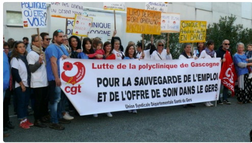
Prêts pour le départ vers la préfecture.