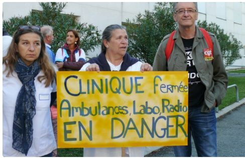
Tout est dit.