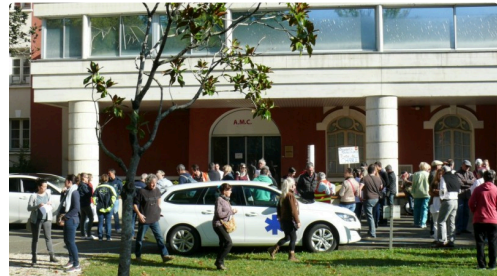
Les salariés et les ambulances arrivent ..

Une épée de Damoclès est suspendue au-dessus de ces salariés de la polyclinique lesquels « sont plongés dans une grande angoisse et incertitude sur leur devenir », résumant les représentants syndicaux.