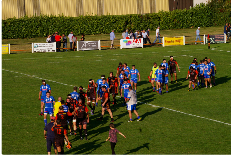
Rugby Fédérale Trois à Nogaro

Derby Nogaro Riscle : Les "Tangos" remportent les deux rencontres