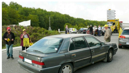
le rond point de La Huré.