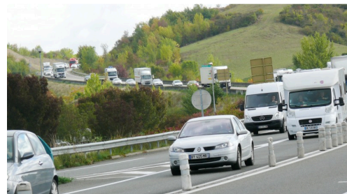
Un bouchon s'est formé sur la rocade d'Auch.

Ce sont 8 représentants de l'Aicra 32 et de l'ANRAF qui ont été reçus à midi par le préfet du Gers auquel a été remise la proposition de loi pour qu'il intervienne auprès du ministre de l'agriculture.