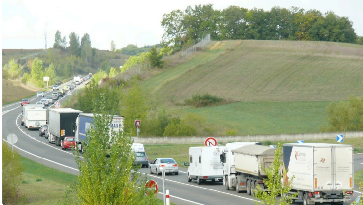
Les retraités agricoles bloquent la rocade d'Auch

Cette matinée du 26 septembre la rocade d'Auch a connu de grosses perturbations de circulation en raison d'une manifestation lancée par l'Association nationale des retraités agricoles de France (ANRAF). Ce sont 31 véhicules et quelques 70 personnes qui de 11 heures à midi ont mis en place une opération escargot laquelle a débuté du rond point de Saint-Cricq pour se conclure au rond point de La Huré, un axe très important qui compte par jour 8 000 véhicules et quelques 2 000 poids lourds. Des délégués de l'ANRAF du Tarn, Tarn et Garonne, et Lot-et-Garonne étaient aussi présents dans le convoi « par solidarité ».