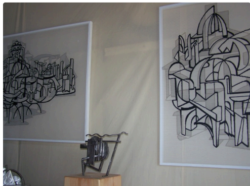
Trames et sculptures de Jean-Patrick Magnoac