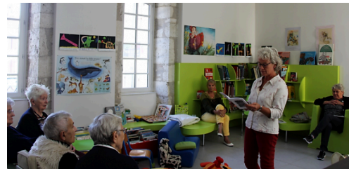
Lecture d'extraits de "Souvenances"

Le public peut se le procurer auprès de l'association LALO http://www.lalo-association.org