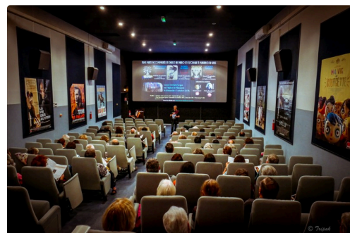
festival muet 7 .jpeg

Il ne reste maintenant qu'à attendre le "concert spirituel" du dimanche 29 octobre à 16 heures dont l'originalité sera également très attrayante, avec orgue, piano, chant et actrice!