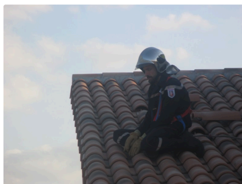
Pompier sur le toit pédagogique