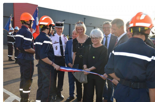
pompier centre vic 1.jpg