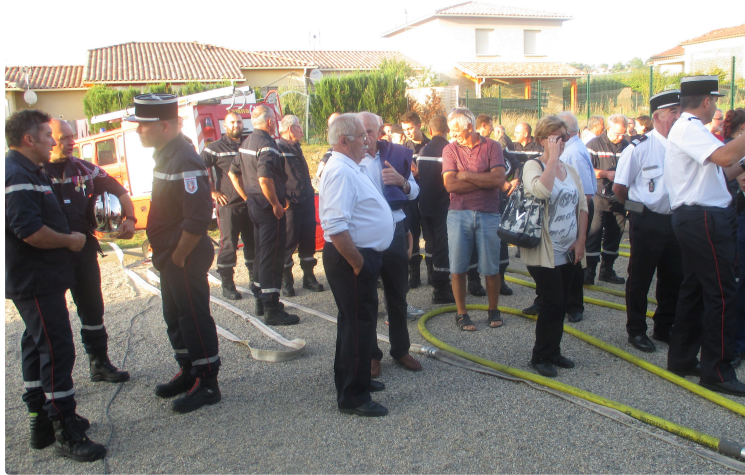
Inauguration du centre départemental de formation

vendredi 29 septembre, avait lieu l'inauguration du centre départemental de formation des sapeurs-pompiers du Gers implanté sur le site du centre de secours de Vic-Fezensac.