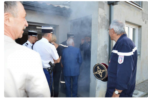
pompier vic centre 3.jpg