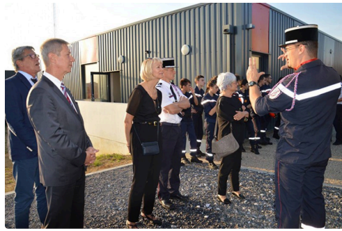
poppiers vic 2.jpg