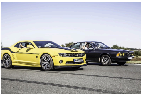
Chevrolet Camaro et BMW v