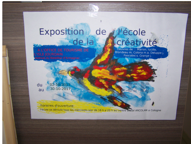
Exposition de l'école de la créativité à l'Office de Tourisme de la Gascogne Toulousaine à l'Isle-Jourdain