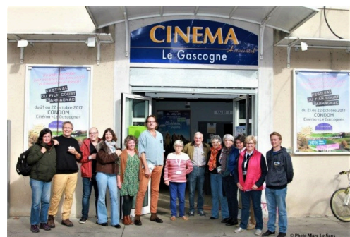
Le Gascogne prêt pour le Festival