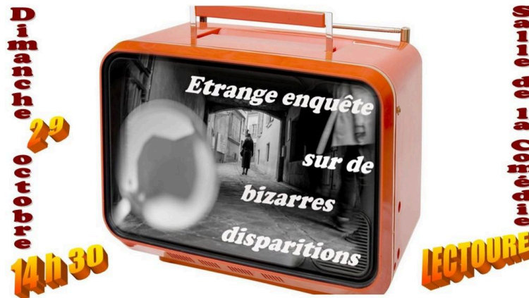
Le festival Bizarre en mode loufoque