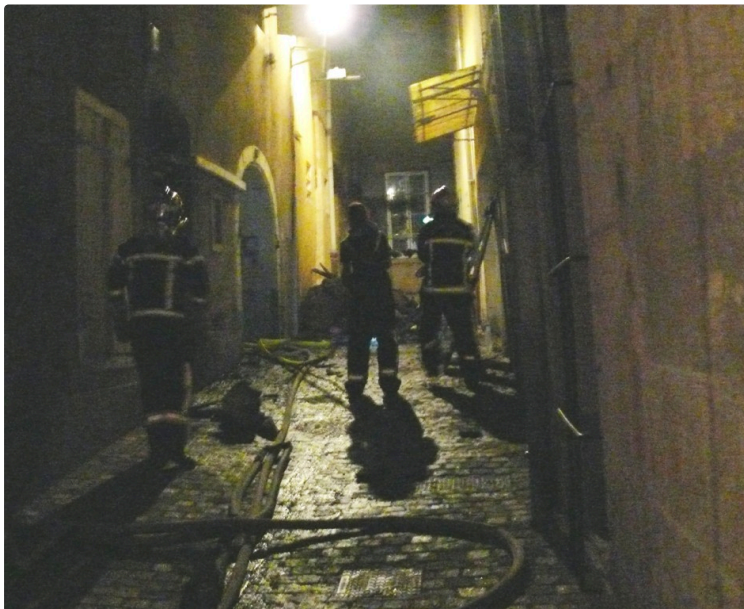
Évacuation d'un immeuble de 3 étages suite à un incendie

Il n'y a pas de victimes mais les dégâts sont importants