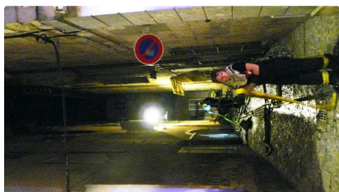
Fin des opérations pour les pompiers.