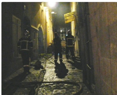
L'impasse Dessoles est une rue étroite et difficile d'accès pour les secours.

Etaient sur place la police, les services ENEDIS pour l'électricité et GRDF pour le gaz ont sécurisé les réseaux.