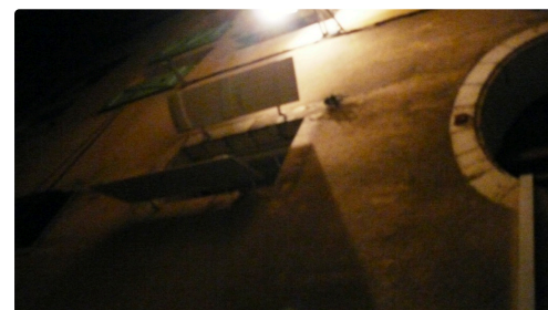
L'étage de l'immeuble.