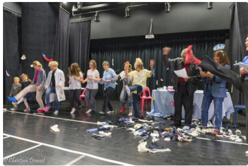
festival bizarre 2017 -88 (1).jpg