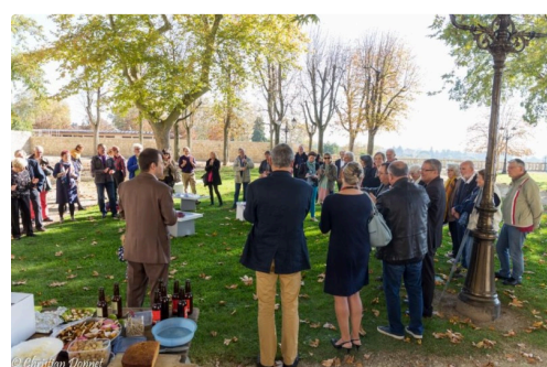
festival bizarre 2017 -50(2).jpg