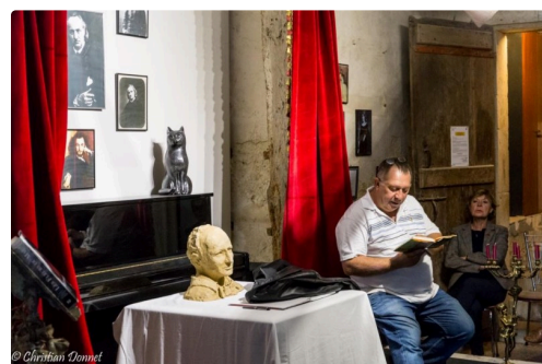
Retour en images sur le Festival