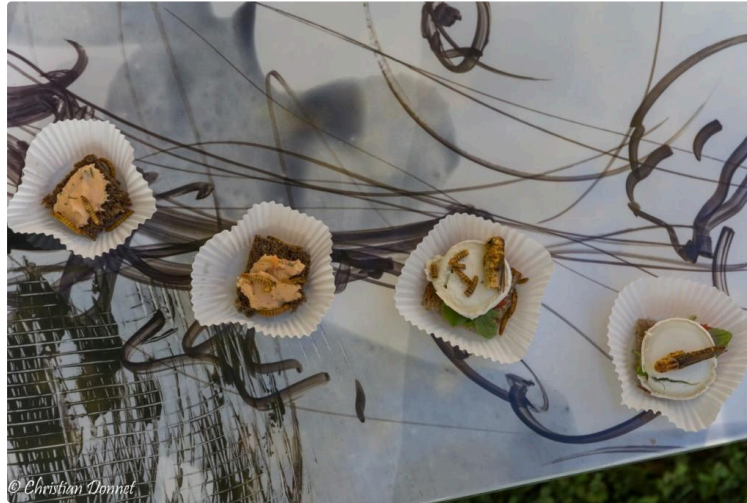
Lecture - Les bizarreries sont passées par là

Le public a répondu présent ce week-end pour assister aux « bizarreries » qui se déroulaient aux quatre coins de la ville. Il faut dire qu'il y en avait vraiment pour tous les goûts et tous les âges.