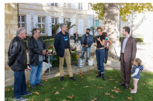
festival bizarre 2017 -40.jpg