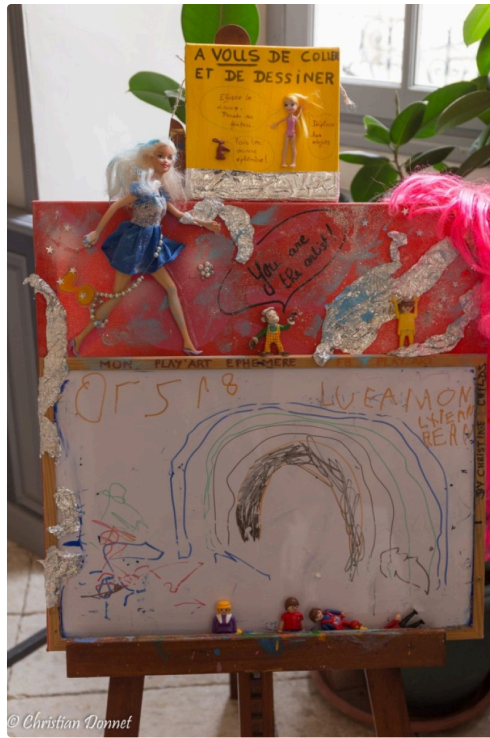
festival bizarre 2017 -71.jpg