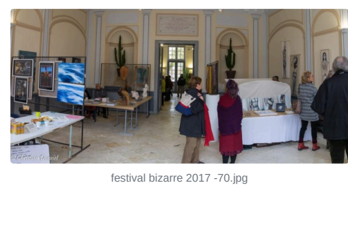
festival bizarre 2017 -70.jpg