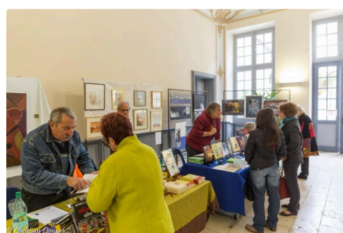
festival bizarre 2017 -69.jpg