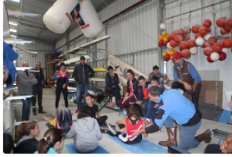
Les rameurs Gersois ont bénéficié d'un stage

Les rameurs Auscitains et Cazaubonnais étaient réunis