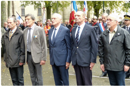
les représentants des associations des anciens combattants.