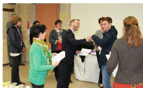
L'ambiance était joyeuse lors de la remise des prix