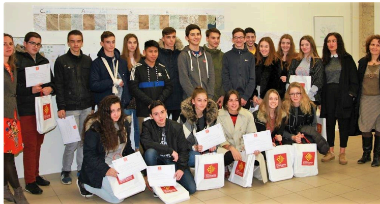
Prix du patrimoine mondial en Occitanie : les lycéens condomois récompensés

Les élèves de 2nde du lycée Bossuet de Condom ont obtenu la deuxième place (sur 943 élèves et 46 projets), au Prix du patrimoine mondial en Occitanie, en présentant leur carnet de voyage sur le Canal du Midi : "L'un vers l'autre, laisser couler le temps".