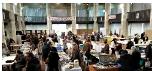
Les amateurs à la recherche de leur bonheur