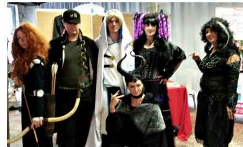
L'association Késaco, très remarquable