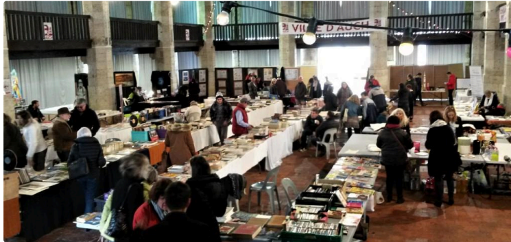
Auch - Première pour le Salon du Livre

Les amateurs de livres et bandes dessinées ont bravé le mauvais temps de ce week-end pour aller chiner du côté de la Maison de Gascogne, où se tenait le 1er salon du livre organisé par l'Amicale des Anciens de Pardailhan, en partenariat avec Philajeune.