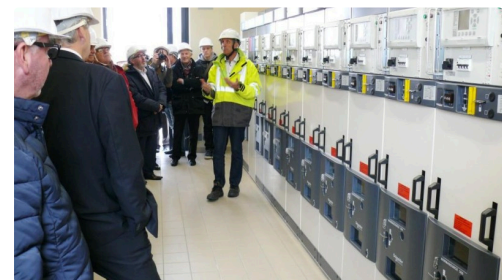
Les coulisses du transformateur.