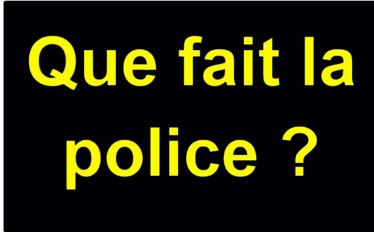
Mais que fait la police ?