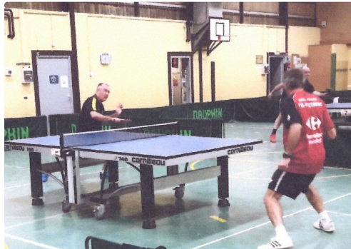
en plein match

Le prochain rendez vous est à la polyvalente lisloise le 25 novembre.