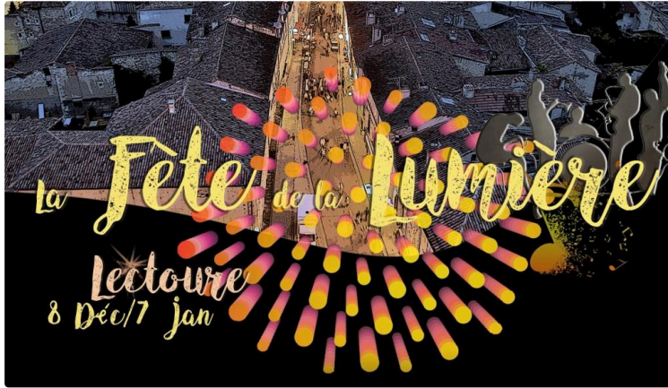
Ouverture de la Fête de la Lumière

A l'approche des fêtes de Noël, Lectoure prend les devants.