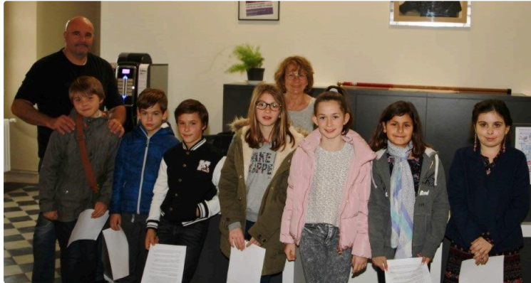
Portes ouvertes au Théâtre des Carmes

L'opération Portes ouvertes au théâtre des Carmes fait partie d'un des projets annuels des sept jeunes de la commission Culture du conseil municipal des enfants.