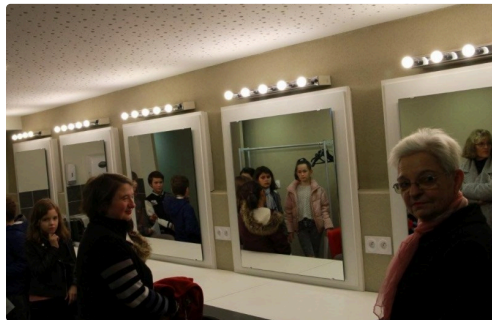
Découverte des loges