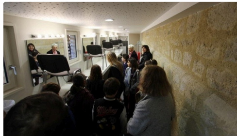
Le public attentif