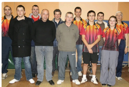
Des membres de l'équipe locale

L'équipe 5 des jeunes pousses affrontait le club de Bas Armagnac. Confirmant de nouveau les progrès constatés à l'entraînement, les jeunes lislois s'imposent sans trembler sur le score de 16 à 2.