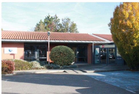
la salle où se sont jouées les rencontres