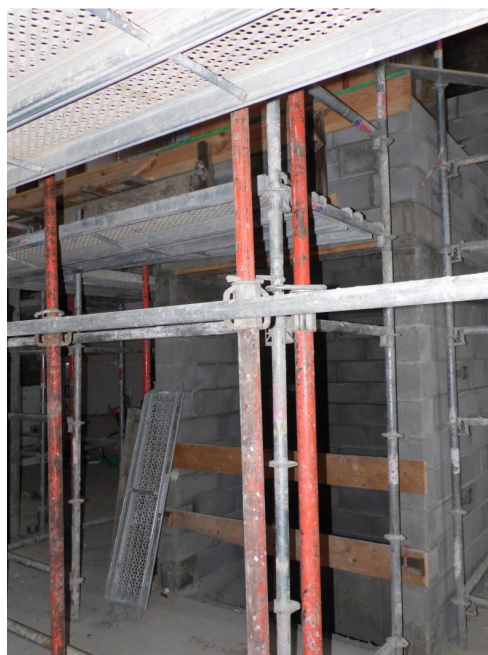
Bâtiment N° 1 la cage de l'ascenseur atteint le niveau de l'étage