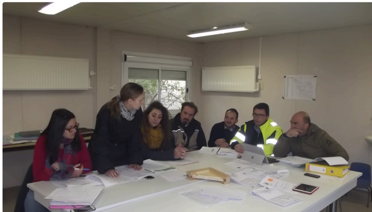
École élémentaire Olléris

À l'école élémentaire Olléris le calendrier d'intervention des entreprises fixé au début du mois est tenu.