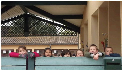
A la "maternelle" située en face les petits sont curieux de voir l'école dans laquelle ils iront plus tard