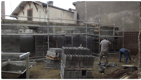
La chaufferie située à l'arrière du bâtiment N°1