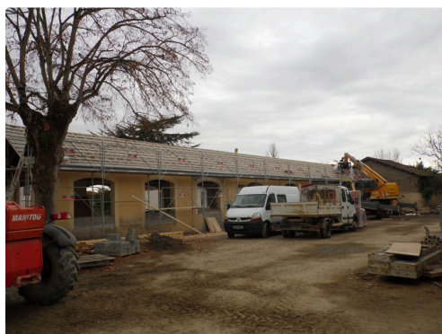
Le bâtiment N°3 en passe d'être couvert

Des menuiseries coté cour intérieure sont déjà posées au bâtiment N° 2 (coté rue Sainte-Quitterie), il sera fermé le 22 décembre quand interviendront les vacances de Noël des écoliers et peut être des entreprises .