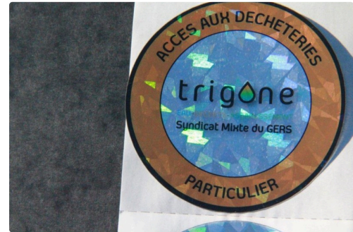
Le macaron pour les particuliers