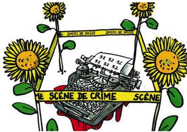
"Festival Polars et histoires de police"