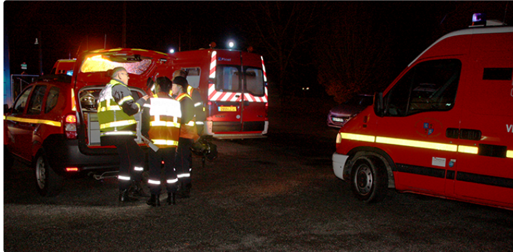
RN21 Carrefour des Trouettes encore un accident

Le carrefour des Trouettes sur la RN21 est très large, offre une visibilité parfaite et pourtant on ne compte plus le nombre d'accidents qui s'y produisent. Ce vendredi passé 19h00, encore, un véhicule circulant sur la D2 file droit sans marquer le stop et traverse la RN21. La collision est inévitable avec un véhicule qui arrive au même instant circulant dans le sens Auch - Mirande