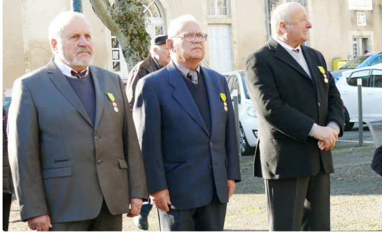
Hommage aux morts en Algérie

Mardi 5 décembre à 11 heures à l'occasion de la journée nationale d'hommage aux morts pour la France pendant la guerre d'Algérie et les combats du Maroc et de Tunisie, une cérémonie a eu lieu au monument aux morts, place Salinis à Auch.