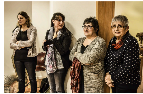
Une partie de l'assistance