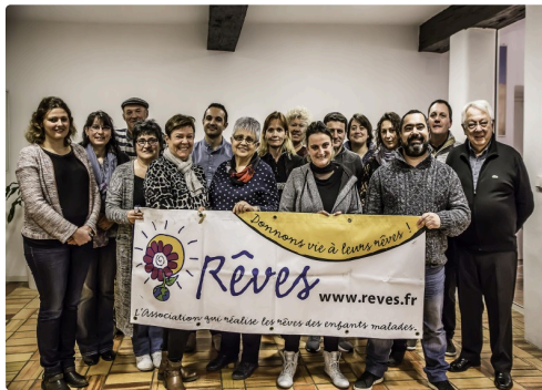
Tous ensemble, artisans taxis et membres de Rêves