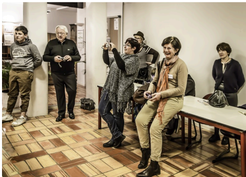
Une autre partie de l'assistance ; au 1er plan, une dame membre de Rêves