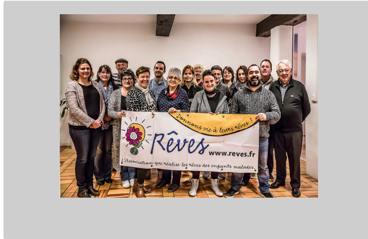
Couloumé-Mondébat – Enguerrand réalise son rêve grâce à Taxis 32

Le jeune malade a rencontré son idole, Rafael Nadal