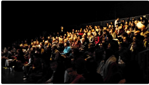
un public nombreux et ravi.