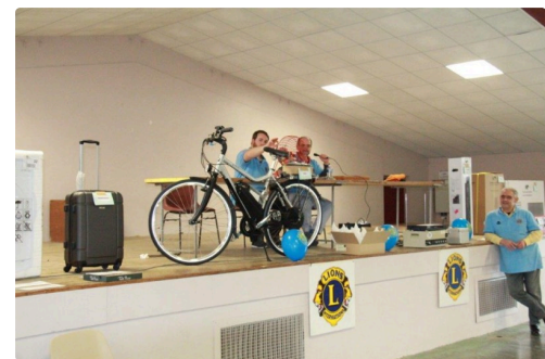
une partie des lots