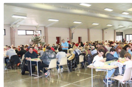
une assistance affairée mais très attentive aussi