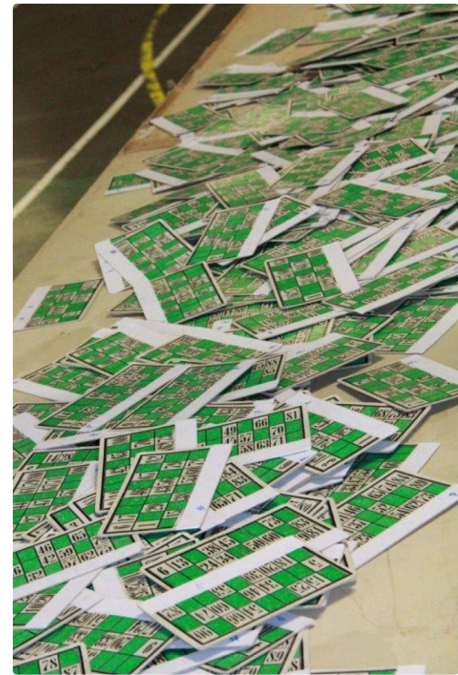
les fameux cartons