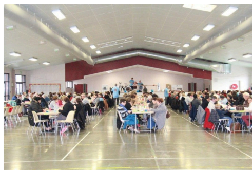
les joueurs de loto