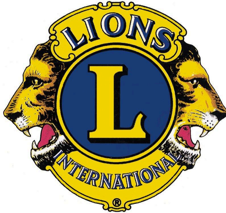
Loto du Lion's Club ce dimanche 17 décembre

Belle action en faveur de ceux qui souffrent de l'atrésie de l'oesophage