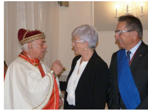
le jumelage Isle/Motta