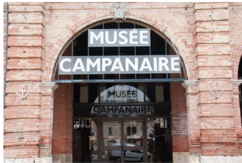
le musée campanaire lislois