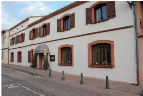
l'établissement en haut de la gamme