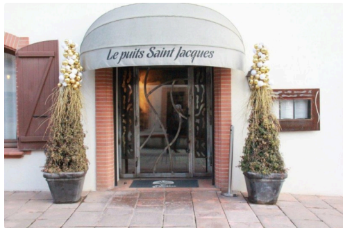
l'entrée du puits Saint-Jacques