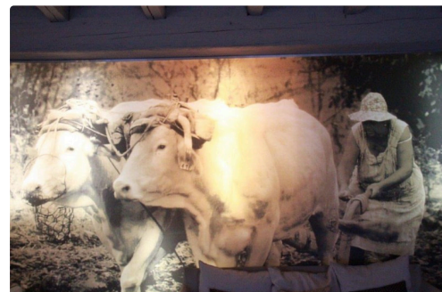
une certaine ruralité dans le vestibule