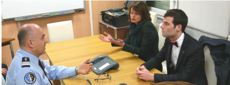
Nuit de la Saint-Sylvestre : La sécurité publique assurée

La sous-préfète de Mirande a rendu visite aux services de sécurité et de secours