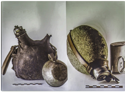
Gourde française et gourde allemand - Document projeté par la conférencière