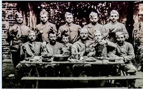
Viella – Le « pinard » pendant la Grande Guerre

Un lien entre soldats et aussi entre le front et l'arrière (conférence)