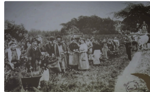
Vendanges avec une majorité de femmes - Document projeté par la conférencière