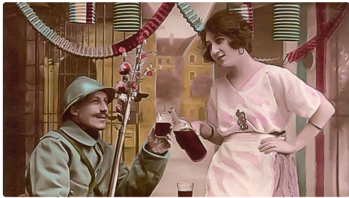
5 La Madelon - Carte postale projetée par la conférencière 1bis 301217.jpg