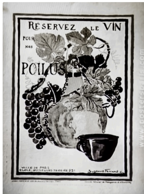
Affiche "oeuvre du vin aux soldats combattants - Document projeté par la conférencière