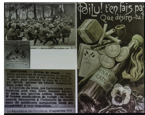
"Gâtez les poilus !" - Document projeté par la conférencière