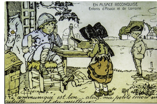
En Alsace reconquise, on boit du vin - Document projeté par la conférencière