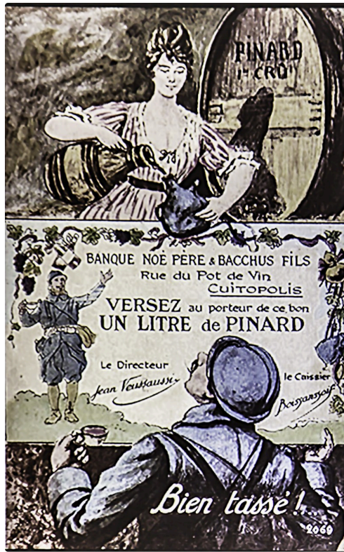
Bon humoristique de pinard - Document projeté par la conférencière