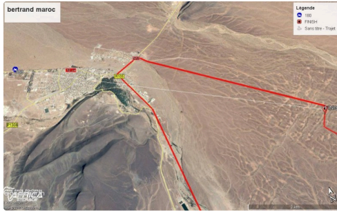
des inquiétudes pour Bertrand en fait non justifiées