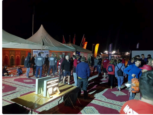
le bivouac