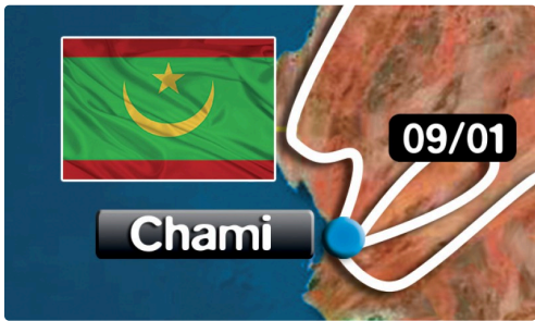
la boucle de Chami