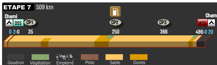
Africa Eco Race 2018 : 7 ème étape le 9 janvier

Bertrand Besse toujours en course pour départ du 10 janvier