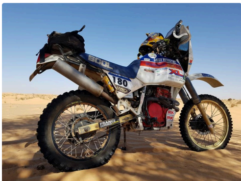
la N° 180 en état