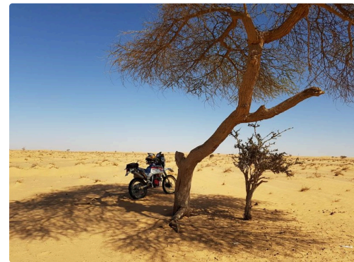
la N° 180 à l'ombre