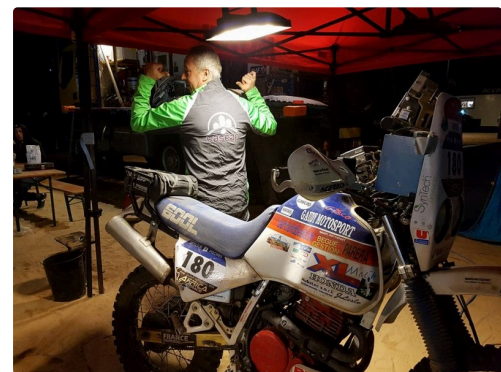
Terre (Cascap) et Sable (Moto)