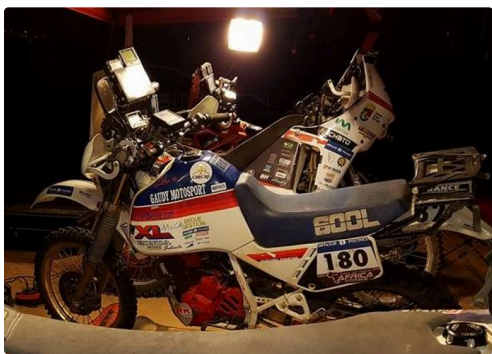
la N° 180 au parking